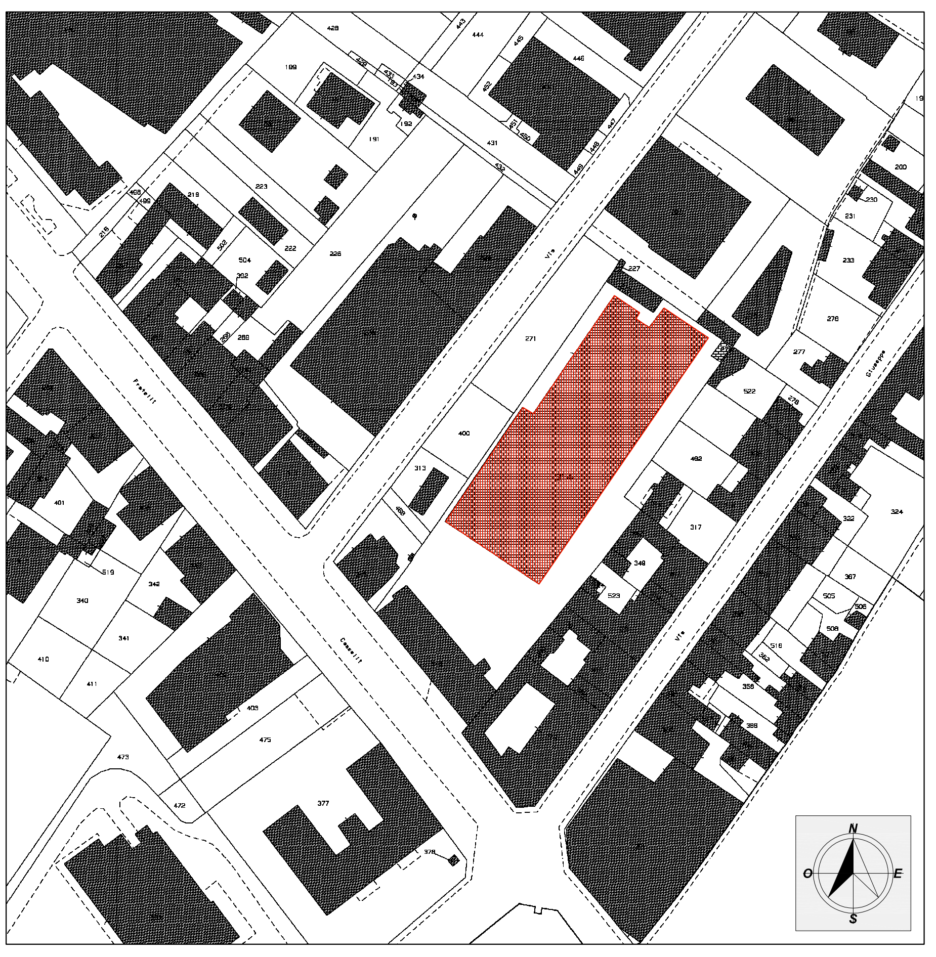
Estratto Catastale Foglio 62 - Mappale 1033-826 Scala 1: 1000